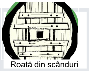
Roată din scânduri

Primele roți erau făcute din scânduri îmbinate între ele și tăiate pe margine în formă de cerc. Roata ușoară, cu spițe, a fost o descoperire